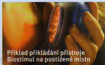
Příklad přikládání přístroje Biostimul na postižené místo

Tento mikropočítačem řízený zdroj polarizovaného světla je účinný proti bolestem, zánětům a výrazně urychluje hojení. Červené polarizované světlo vysoce svítících LED diod nepůsobí jen jako zdroj povrchového tepla, ale proniká i do hlubších struktur tkání, kde vyvolává fotochemické změny a tím urychluje hojení. Vyniká svou neomezenou mobilitou (vestavěné ekologické dobíjecí akumulátorové