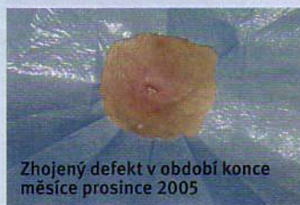
Zhojený defekt v období konce měsíce prosince 2005