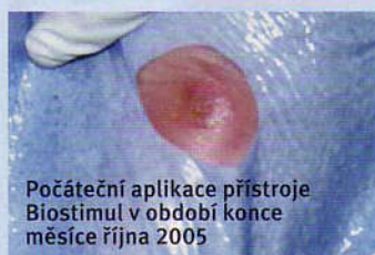
Počáteční aplikace přístroje Biostimul v období konce měsíce října 2005