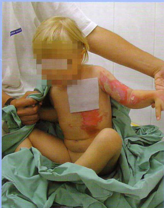
Možnosti léčby popáleninového traumatu