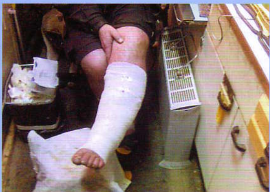
Ošetření chronických ran v domácí péči